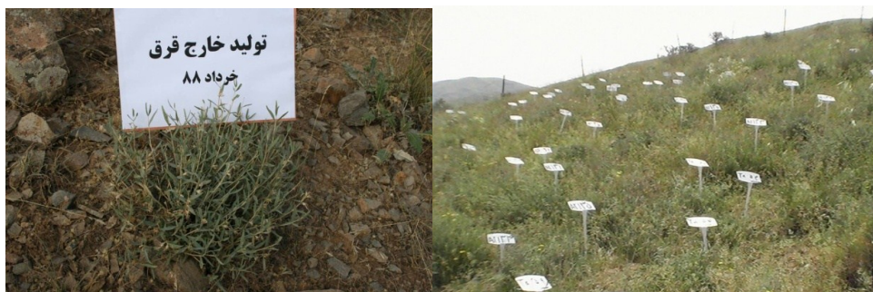
شکل ۱- انتخاب پایه‌های متوسط در داخل قرق (سمت راست) و تولید گونه آجوگا خارج قرق (سمت چپ)

کم اکثر گونه‌ها در ترکیب گیاهی و برای پرهیز از برداشت تعداد زیاد نمونه که بایستی به‌طور تصادفی صورت می‌گرفت، از پایه‌های متوسط گونه استفاده شود لذا از گونه مورد نظر در هر ماه حداقل پنج پایه متوسط در داخل و پنج پایه متوسط نیز در بیرون قطعه محصور انتخاب و علامت‌گذاری شد و در موعد مقرر تمام تولید این پایه‌ها برداشت گردید. برای تعیین اندازه پایه متوسط در یک آماربرداری شدید به‌صورت تصادفی سیستماتیک، پوشش تاجی و تراکم گونه در داخل قطعه محصور برآورد شد و از تقسیم پوشش کل به تراکم کل پوشش متوسط گونه تعیین گردید. هر ماه علوفه برداشت شده از سایت به ازای هر پایه و گونه در داخل پاکت‌های جداگانه به آزمایشگاه حمل و پس از خشک شدن در هوای آزاد و توزین نمونه‌ها، وزن علوفه خشک، مبنای محاسبات علوفه تولید شده و مصرف شده در سایت قرار گرفت. با مقایسه تولید گونه در ماه‌های مختلف روند رفتار رویشی گونه در مرتع تعیین و زمان حداکثر تولید آن معین گردید. با مقایسه مصرف دام از گونه در ماه‌های مختلف، زمان و میزان استفاده از گونه در مقاطع زمانی فصل چرا روشن شد. سرانجام به‌منظور تأثیر سال‌های مورد مطالعه و ماه‌های برداشت بر تولید و مصرف گونه مورد بررسی، اعداد و ارقام حاصل در نرم افزار SPSS مورد بررسی تجزیه واریانس مرکب در قالب طرح کاملاً تصادفی قرار گرفت. سپس با روش دانکن در سطح ۵ درصد برای اثرات اصلی سال و ماه مقایسه میانگین برای تولید و مصرف مرتع مورد مطالعه انجام شد. برای ترسیم نمودارها از نرم افزار Excel استفاده شد.